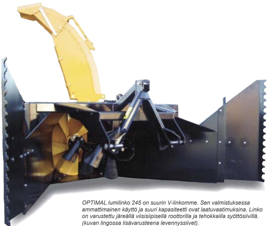
OPTIMAL lumilinko 245 on suurin V-linkomme. Sen valmistuksessa ammattimainen käyttö ja suuri kapasiteetti ovat laatuvaatimuksina. Linko on varustettu järeällä viisisiipisellä roottorilla ja tehokkailla syöttösiivillä. (kuvan lingossa lisävarusteena levennyssiivet).