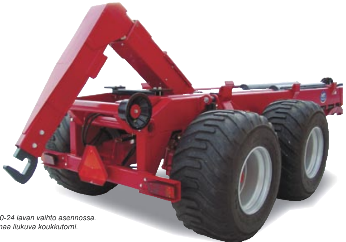
MT 20-24 lavan vaihto asennossa. Huomaa liukuva koukkutorni.